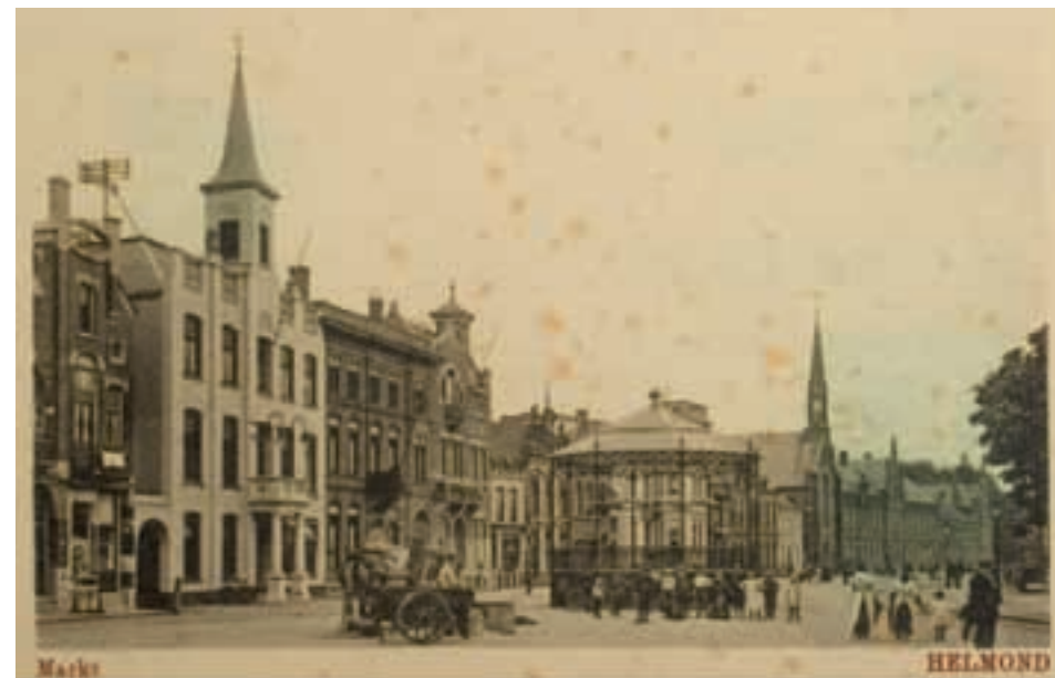
Opname van de Markt rond 1930. De muziekkiosk schijnt recht voor het raadhuis (het witte gebouw met het torentje) te staan (afb. 5).