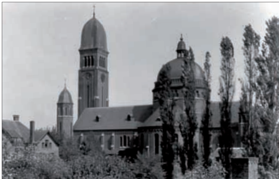
O.L.Vrouwekerk in de dertiger jaren gezien vanaf de Mierloseweg.

eerste kerk, binnen de stadsmuren van Helmond een parochiekerk gebouwd. Eeuwenlang is de Sint Lambertus de enige parochiekerk van Helmond. Pas in 1899 komt er een tweede parochiekerk tot stand, en wel de Heilig Hartkerk in de Veestraat. Helmond groeit