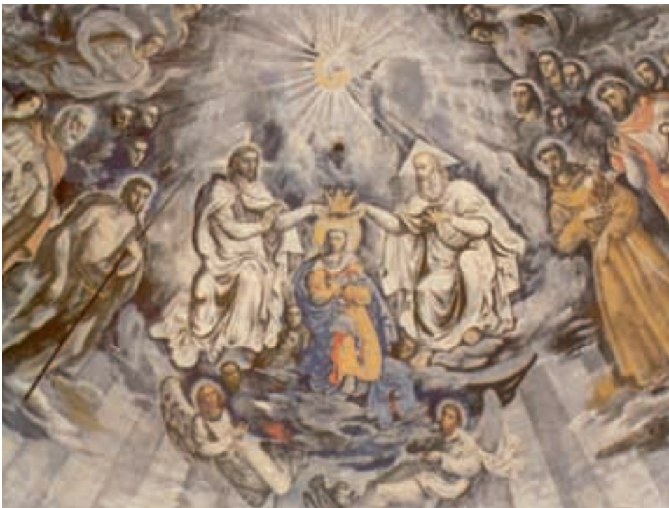
De schildering van Charles Eyck van de Kroning van Maria door de Heilige Drievuldigheid in de hoofdabsis.

kwam een handtekeningenactie en vrijwel iedereen tekende. Vervolgens ging men naar Den Bosch, om bij bisschop Van de Ven de stichting van een nieuwe kerk aan de westzijde van het kanaal te bepleiten. Deze actie had succes. Bouwpastoor Van der Hagen kreeg op 1 april 1911 een brief van de bisschop met de opdracht voorlopig niet tot aanbesteding van de kerk aan de Blinkertsestraat over te gaan. Hierop volgde een nieuwe indeling van de parochie van Sint Lambertus en het Heilig Hart. Er ontstond nog oneenigheid of de kerk in de Haag of aan de Steenweg gebouwd moest worden. Uiteindelijk werd gekozen voor de Steenweg. Op 29 november 1912 werd