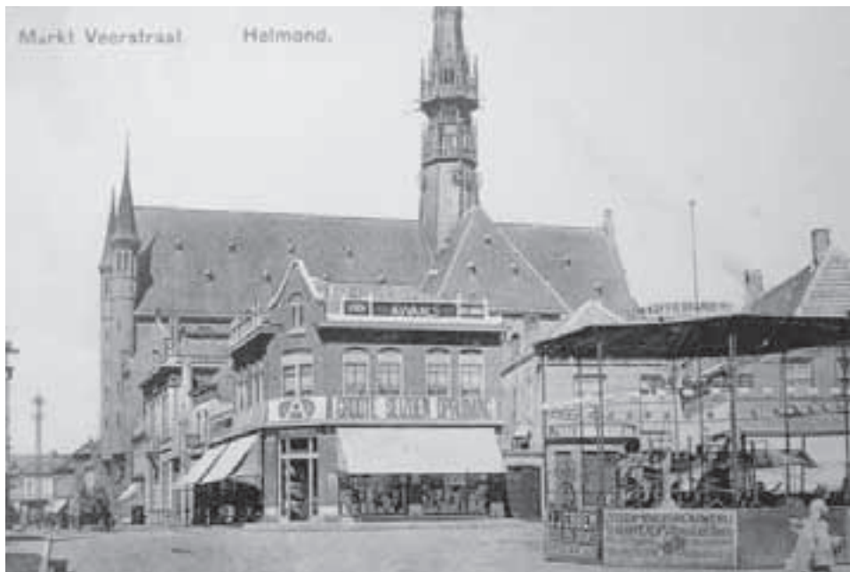
De Markt vòòr 1919 met de eerste muziekkiosk voorzien van reclameborden (afb. 1).