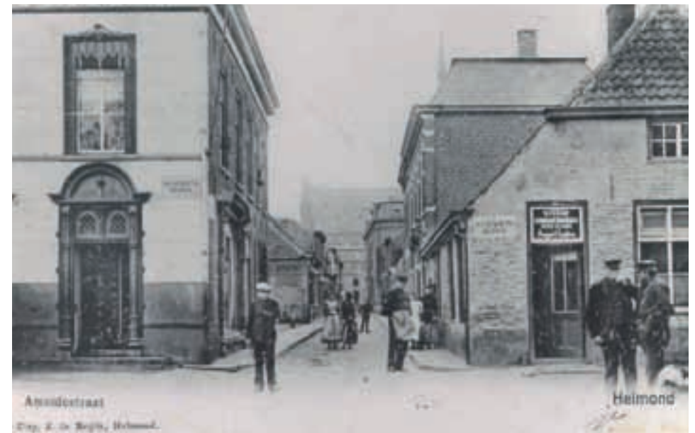
Ameidestraat in 1907 gezien vanaf de Noord- en Zuid-Koninginnewal is genoemd naar het riviertje De Ameide, in de volksmond 'De Mei' genoemd. Vandaar dat het smalle straatje ook wel het 'Meistraatje' wordt genoemd (zie pag. 22).

Bijvoorbeeld het Bantstraatje, het Sterckenstraatje, het Sweertsstraatje, het Abenstraatje, het Pottenstraatje en het Tijjegangske, de Molensteeg, de Zestienwoningen, enz.