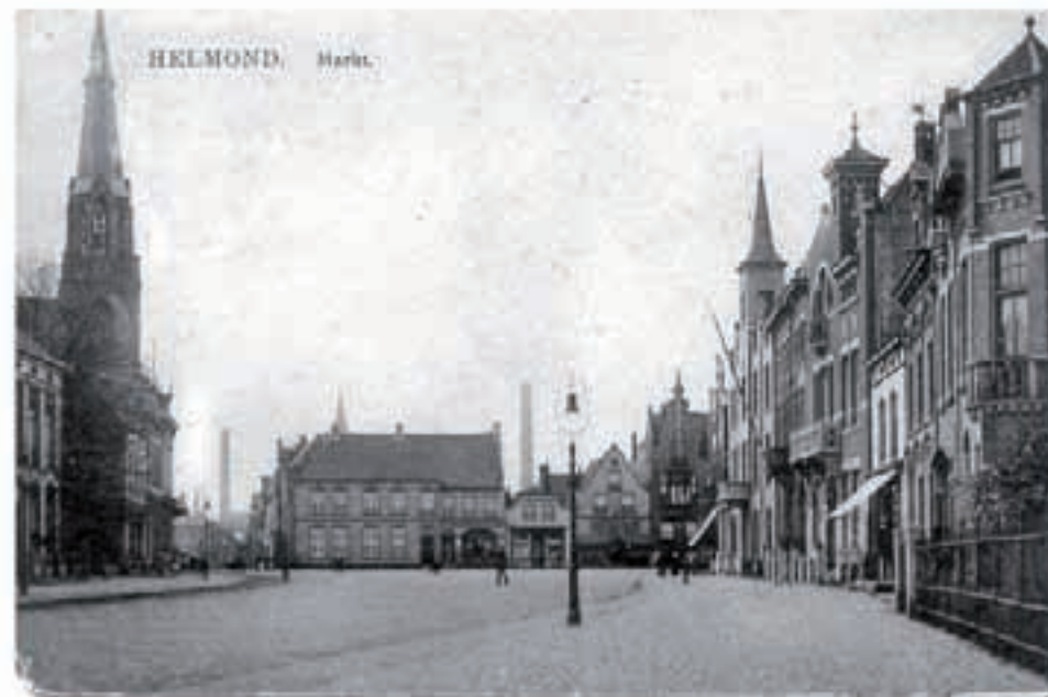
De Markt in 1913 zonder muziekkiosk (afb. 4).