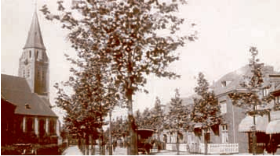
Bakelsedijk ±1935 met jonge platanen, paard en wagen en de St.Jozefkerk. De Bakelsedijk loopt van het Tolpostplein tot aan de grens met Bakel (zie pag. 24).

Hieronder een lijst van verdwenen oude straatnamen in Helmond, gevolgd door verdwenen straatnamen in Brouwhuis, Rijpelberg, Dierdonk, Stiphout en Mierlo-Hout. Zie voor omschrijving De Vlasbloem nr. 7 en 8.