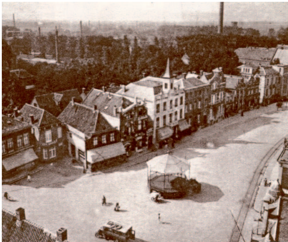
De Markt in 1925 met de tweede muziekkiosk Opname gemaakt vanuit de toren van de St. Lambertuskerk. De kiosk staat centraal op de Markt (afb. 3).