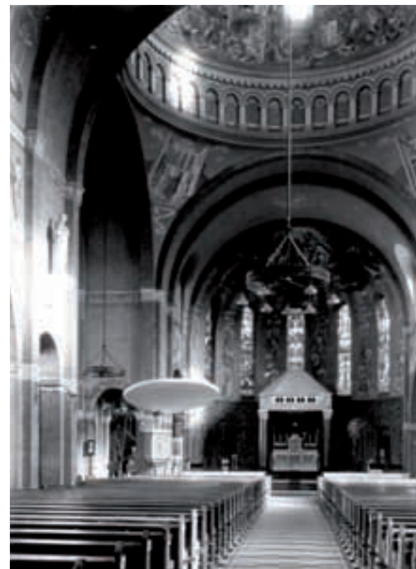
Het interieur van O.L.Vrouwekerk

Charles Eyck de attractie van de kerk. Hij heeft ze tussen 1940 en 1949 aangebracht. Charles Eyck (1897-1983) was een Nederlands expressionistisch schilder. Hij begon zijn loopbaan als plaatschilder bij de Sphinx-fabrieken in Maastricht. Als gevolg van een ziekte op elfjarige leeftijd werd hij doof. De schrijfster Maria Voila zorgde er voor dat hij op een instituut kon leren liplezen en zich bekwamen in het schilderen. Hij kreeg zijn opleiding voor de monumentale kunst, zoals wandschilderingen, glas in lood, grisailles op opalineglas aan de Rijksacademie te Amsterdam. Op vijftienvijftigjarige leeftijd won