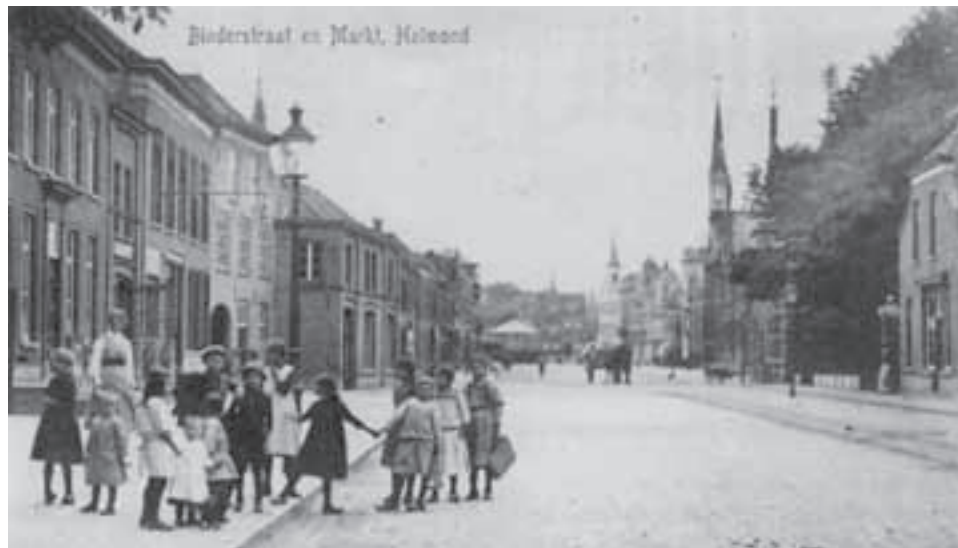
Binderstraat ±1919 gezien in de richting de Markt. In het pand links is nu de woonwinkel 'De Lantaarn' gevestigd. In de verte is ook nog de muziekkiosk te zien.

In Stiphout werden voorheen de straatnamen vastgesteld rond 1954.