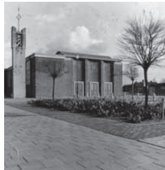
Sint Annaplein met kerk in de zestiger jaren.

Genoemd naar het riviertje De Ameide, dat in 1934 is overkluisd. Aan de noordkant van de Ameidewal lag de fabriek van Prinzen en van Glabbeek, opgericht in 1857 in 1871 een groot bedrijf met 130 handgetouwen;