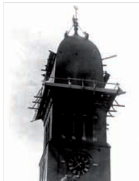
De toren is bijna voltooid, het plaatsen van de haan is het sluitstuk. Een opname van rond 1925.

in die jaren sterk. Er komt al snel grote behoefte aan een derde parochiekerk.