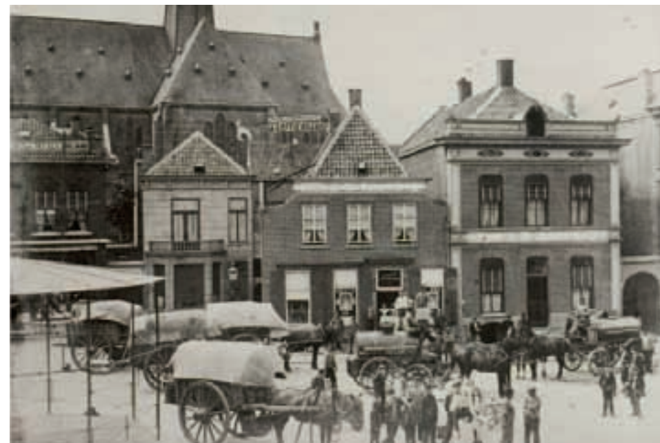
De Markt rond 1910 met linksonder nog zichtbaar, een deel van de muziekkiosk (afb. 2).

De eerste kiosk heeft een heel eenvoudige constructie en een tamelijk plat dak. Het hekwerk langs het speelplatform bestaat uit eenvoudige kruisen. Er zijn overigens ook foto's waarop die balustrade voorzien is van reclameborden (afb. 1).