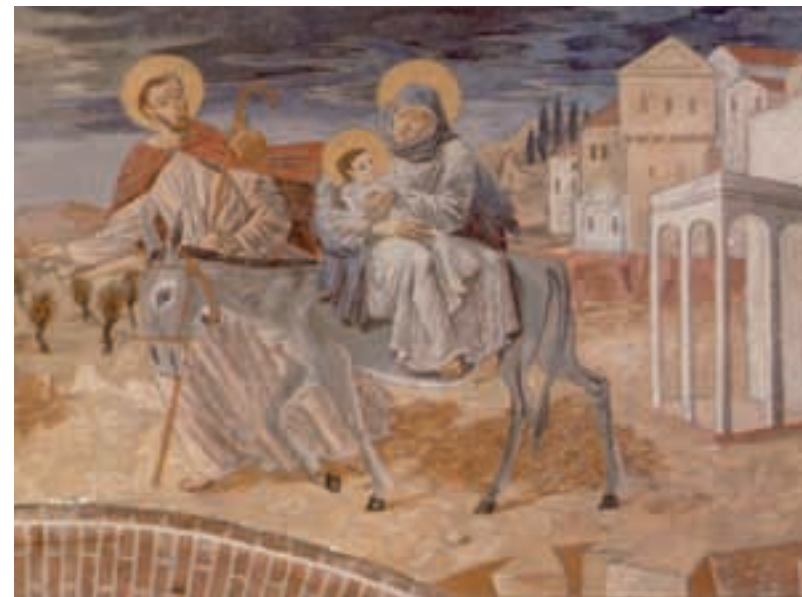
Vlucht naar Egypte.